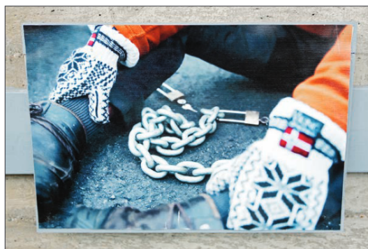
Et av Grimens sterke dokumentarbilder fra prosjektet man kan se på utstillingen.

– Jeg vil at folk skal reflektere over saken. At det er en slags ærlig gjenfortelling av saken som gir en reaksjon av hos folket og åpner for videre debatt om miljø og inngrep i naturen, uten å legge føringer for dette men la folk reflektere selv, avslutter Grimen.