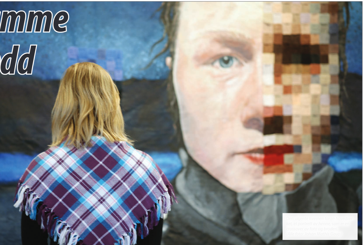
Den ukjente kvinnen foran hovedbiletet, et portrett av henne, som er en crossover av foto og brodet.

nene. At noen kommer og ta seg til rette og vil ødelegge havet vårt og fjellene våre. Disse følelsene er også grunnlaget for diktet utstilt sammen med verket, forteller kvinnen.