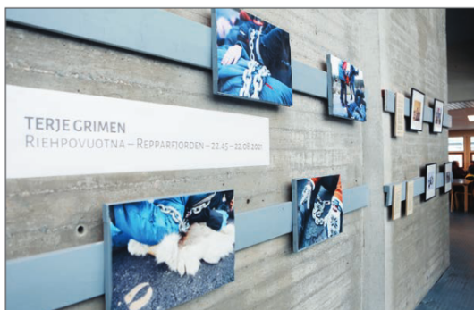
Utstillingen består også av flere dokumentarfoto fra Repparfjorden. Kunstneren ønsker at folk skal betrakte, reflektere og gjerne debattere det de ser og temaet.